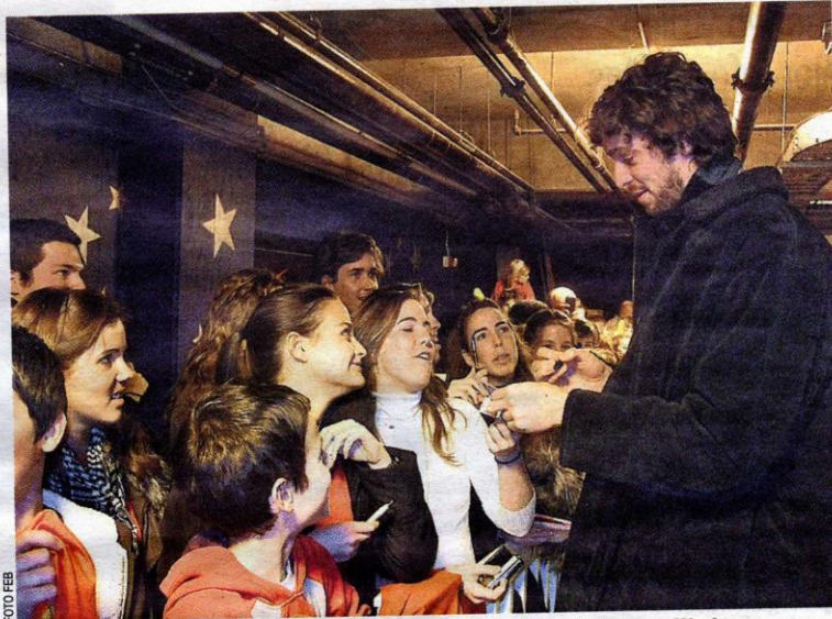
Gasol firma unos autógrafos a algunos de los 200 fans españoles que fueron a Washington.

También espero que Calderón pueda disfrutarla, aunque lo tiene realmente complicado. Ser reserva del Este en el All Star está realmente caro este año con Billups , Ray Allen o Hamilton y alguno más que me dejó pero lo importante es que se le ha considerado como serio aspirante a uno de esas plazas como reserva. Me alegro mucho por él porque se lo está currando y está jugando a un gran nivel en un